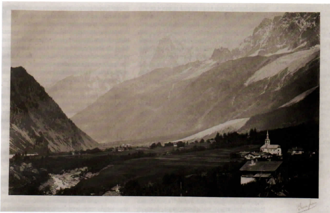
Sopra: Bisson Frerés [Auguste-Rosalie Bisson]. Savoie 20. "Entrée de la Vallée de Chamonix, aux Ouches".